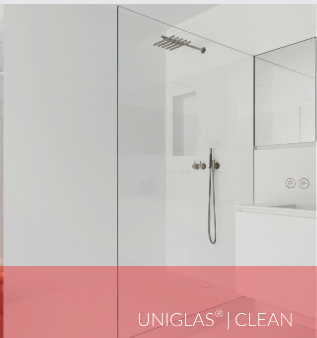
UNIGLAS® | CLEAN

Ondanks regelmatige reiniging verliest het glas van geheel glazen douches, douchewanden en douchecabines mettertijd zijn glans. Kleine, melkachtige, ruwe plekken ontstaan op het glasoppervlak, waar kalk, vuil en ongezonde schimmels zich dan graag ophopen.